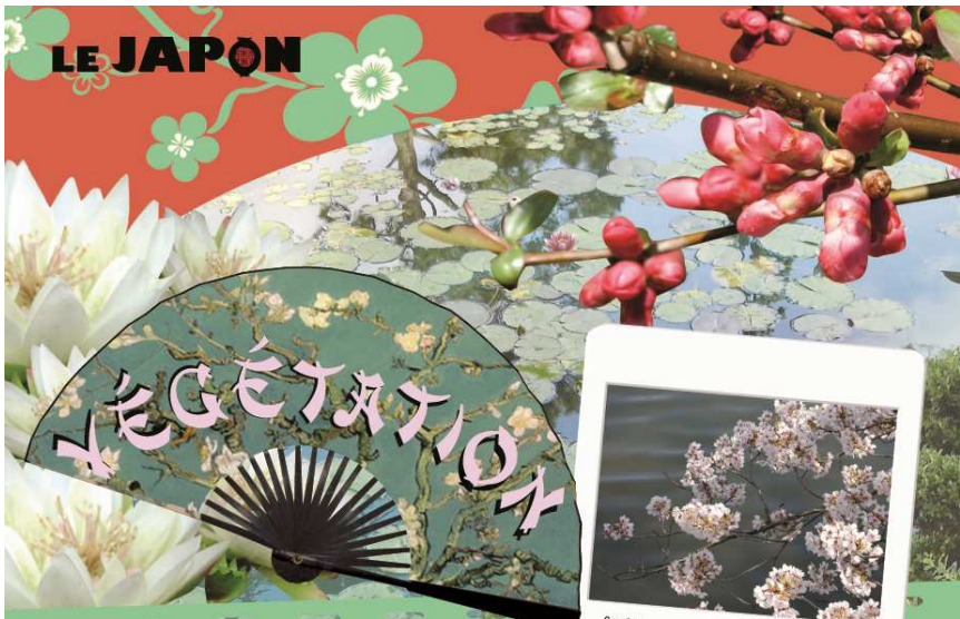
Cerisiers en fleurs à Kuwana en avril