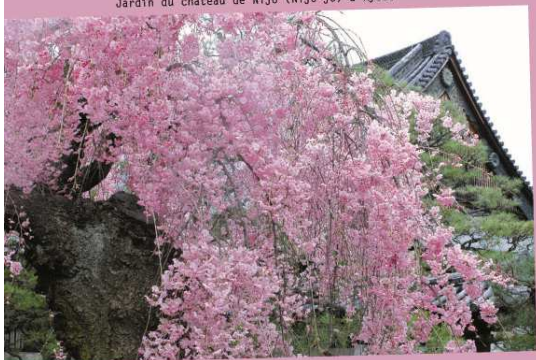
Temple à Kyoto