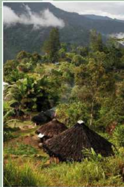
Habitat isolé en Nouvelle Guinée Occidentale (Indonésie)

Les hôtels dans les arbres prolifèrent. Les citadins recherchent l'évasion et le contact avec la forêt.