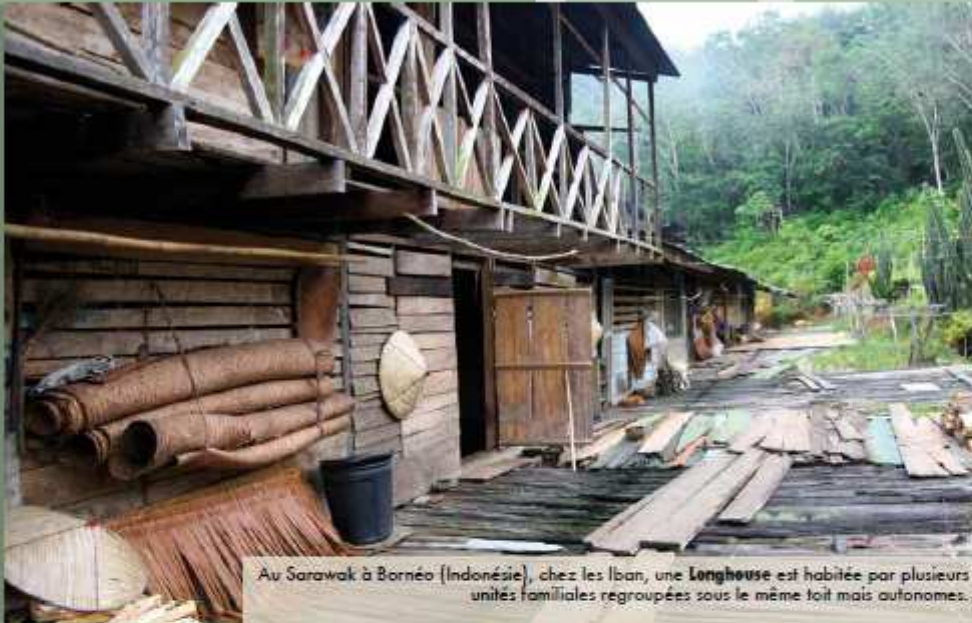
Au Sarawak à Bornéo (Indonésie), chez les Iban, une Longhouse est habitée par plusieurs unités familiales regroupées sous le même toit mais autonomes.

Les Iban, comme d'autres peuples, ont tenté de stopper la destruction de la forêt... Ils ont aussi des difficultés à préserver leur héritage culturel.