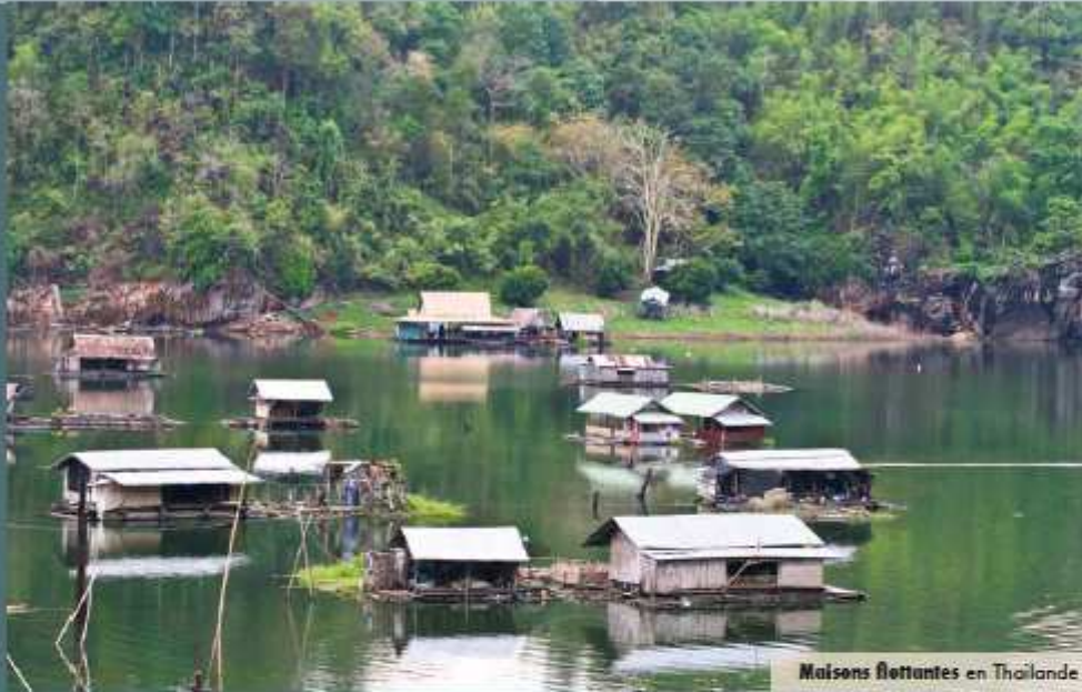
Maisons flottantes en Thaïlande