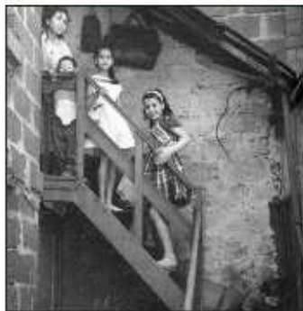
Le Joli mai de Chris Marker, 1962.

Autour de Richard Leacock (ancien opérateur de Flaherty), aux USA se réalisent les films : « Primary » sur la campagne de J.F. Kennedy (1960), « Don't look back », film sur Bob Dylan, par D.A. Pennebaker (1966), « Salesman » des frères Maysles . (1969).