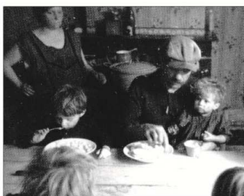
Misère au Borinage, de Henri Storck, 1933.

du « ciné œil » ( kino glaz ), privilégie le montage et ses immenses possibilités. Elle est représentée par Dziga Vertov et son film emblème, « L'Homme à la caméra » (1929)