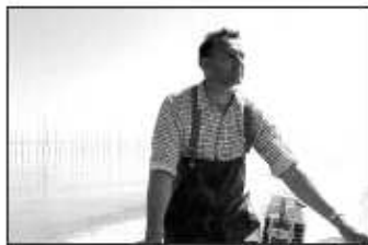
Pour la suite du monde de Pierre Perrault, 1963.

Il se développe au croisement de plusieurs évolutions techniques et de différentes expériences. Avec la mise au point de caméras légères et d'appareils d'enregistrement sonore synchrone (le magnétophone Nagra) la parole devient alors un acteur de premier plan.