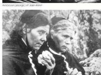
Finis terrae, de Jean Epstein, 1929.

Il est temps de rappeler que le mot même de « documentaire » apparaît dans le langage cinématographique en 1926 sous la plume du cinéaste anglais John Grierson à propos de « Moana », film de John Flaherty.