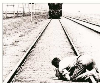
L'Homme à la caméra de Dziga Vertov, 1929.

joue aussi la carte de l'esthétique avec Walter Ruttmann dans « Berlin, symphonie d'une grande ville » (1927).