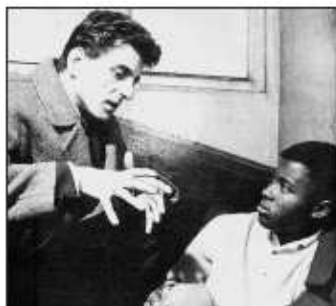
Chronique d'un été de Jean Rouch, 1961.

Les films vont à la rencontre des autres et suivent les mutations de la société et les remous de l'histoire.