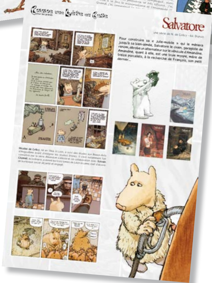
Exemples panneaux pour adultes