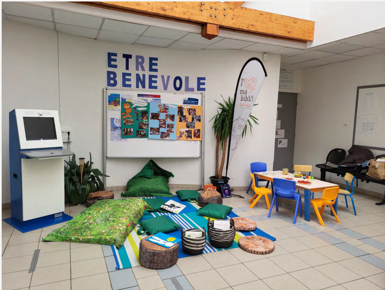
Bibliothèque éphémère à côté d'une borne de services