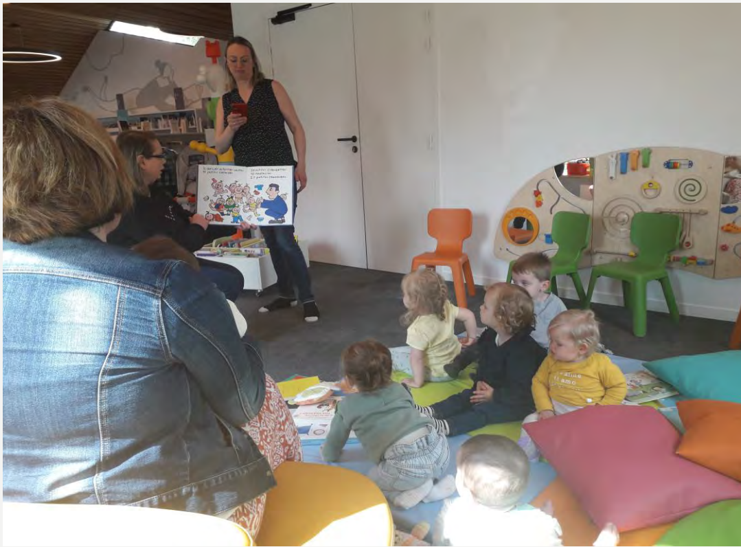
CLEA en bibliothèque