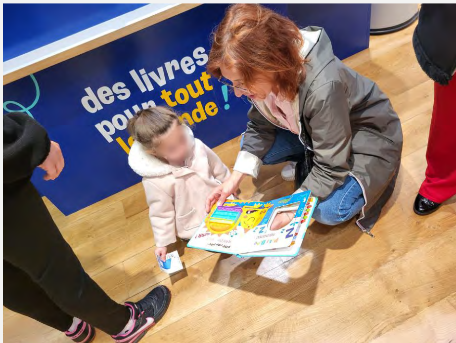
Sorties en librairie en famille