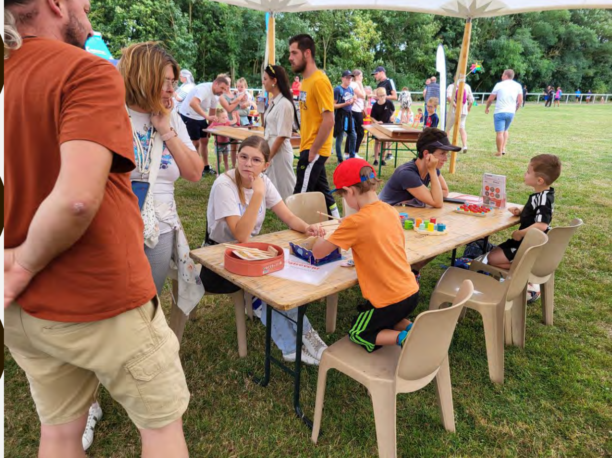
Bib' Estiv 2023 et 2024